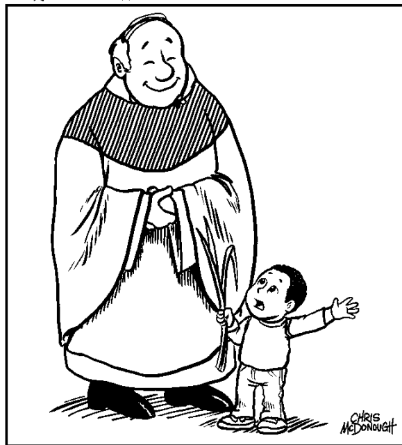
"If Santa Claus is really Saint Nicholas, then which saint is the Easter Bunny really?"

© 2003 WLP, a division of J.S. Paluch Co., Inc.